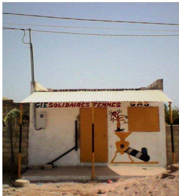
Local abritant les moulins

Dans les conclusions le maire et l'ambassadeur souhaitent une concertation avec les partenaires afin d'éviter des actions ne répondant pas à leurs priorités : éviter la concentration des actions sur quelques villages en particuliers Ndianda et Nguéniene, éviter les doublons. P. Lemoine