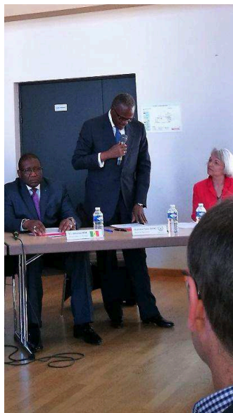
M. L'Ambassadeur et le maire de Ngueniene